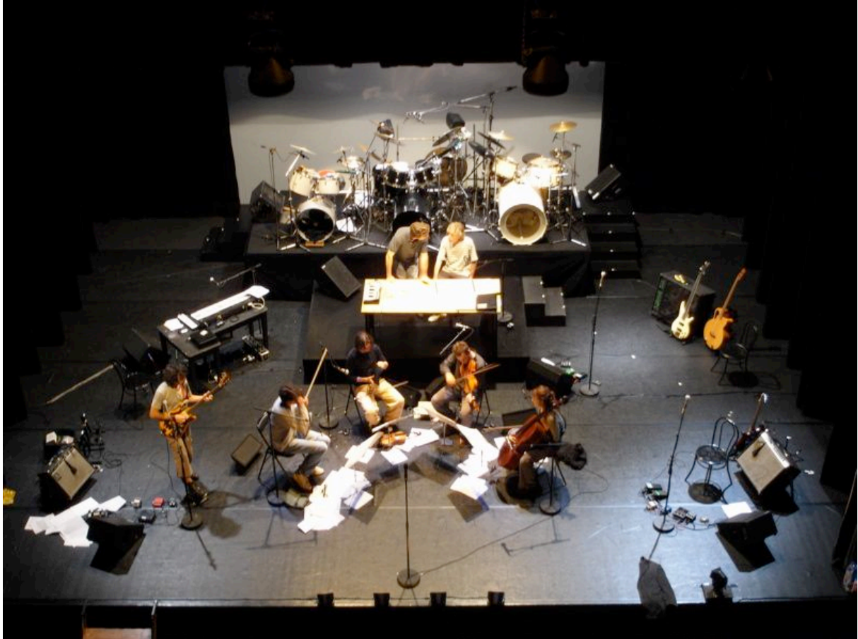
Usage Technique : ne pas diffuser SVP